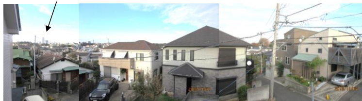
※図面と現況が異なる場合は現況を優先します。