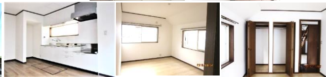
諸設備全て新設しました♪