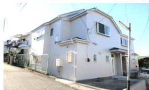
お洒落な白い外観です♪