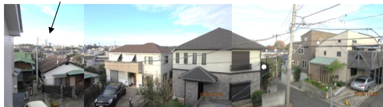
※図面と現況が異なる場合は現況を優先します。