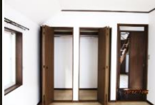
諸設備全て新設しました♪